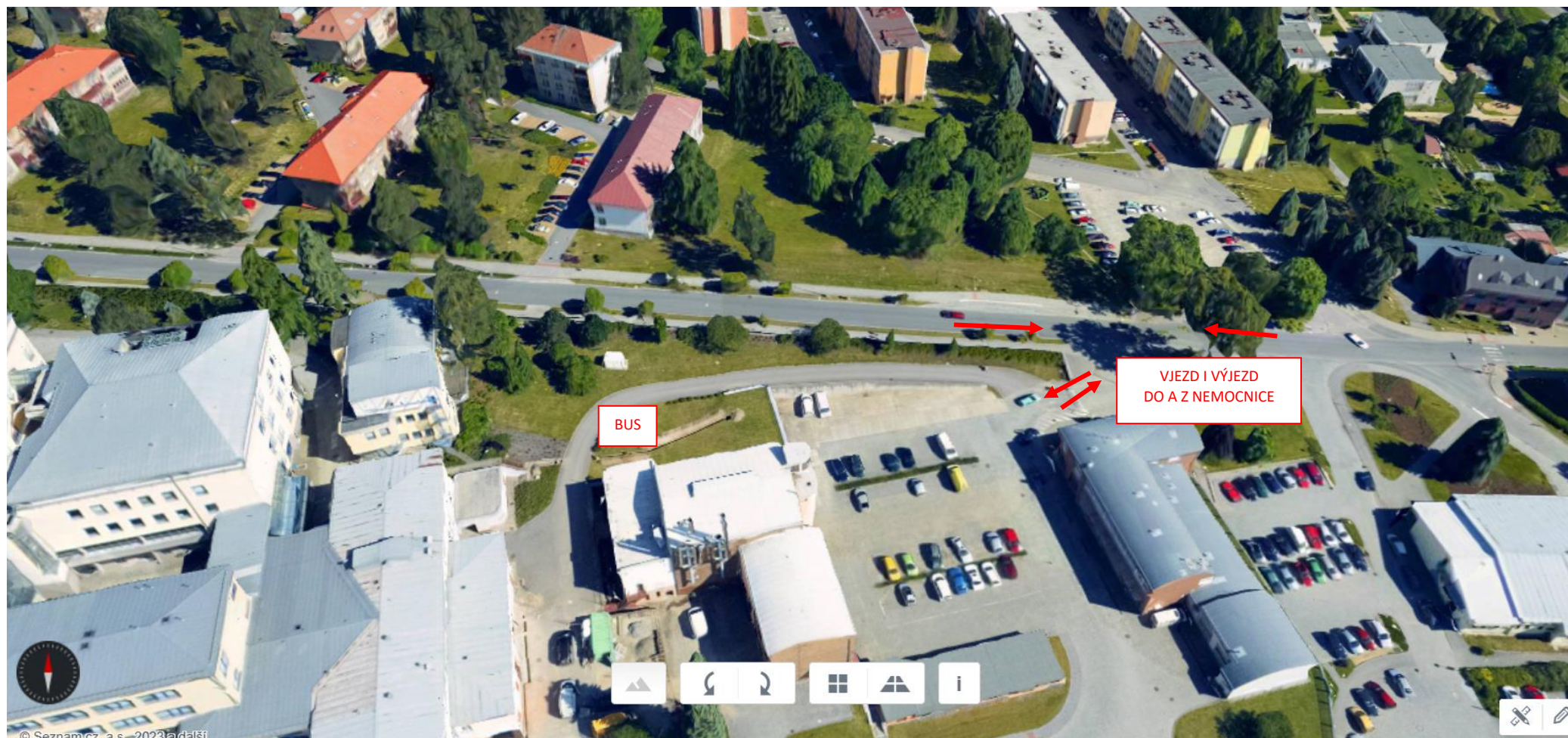
Obr. 2 NOVÝ VJEZD DO NEMOCNICE, UMÍSTĚNÍ AUTOBUSOVÉ ZASTÁVKY